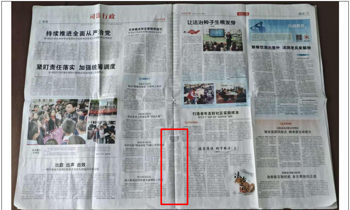
图 3.2-2 第二次公示报纸公示 (1)