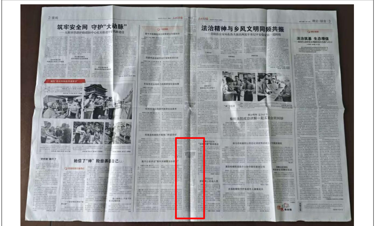
图 3.2-3 第二次公示报纸公示 (2)