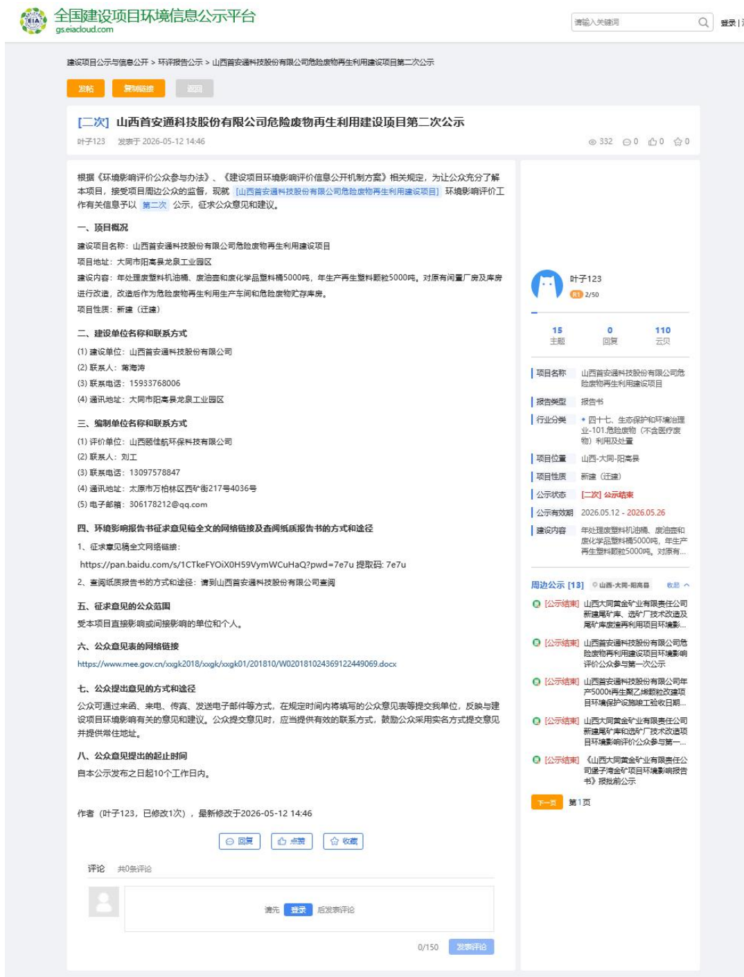
图 3.2-1 环境影响评价公众参与第二次公示