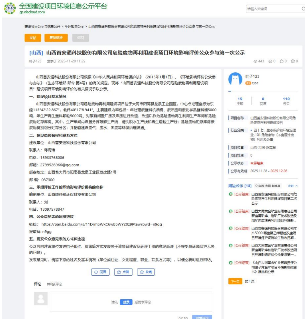
图 2.2-1 环境影响评价公众参与第一次公示