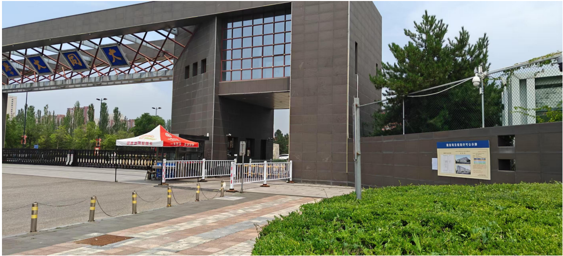
大同大学御东校区