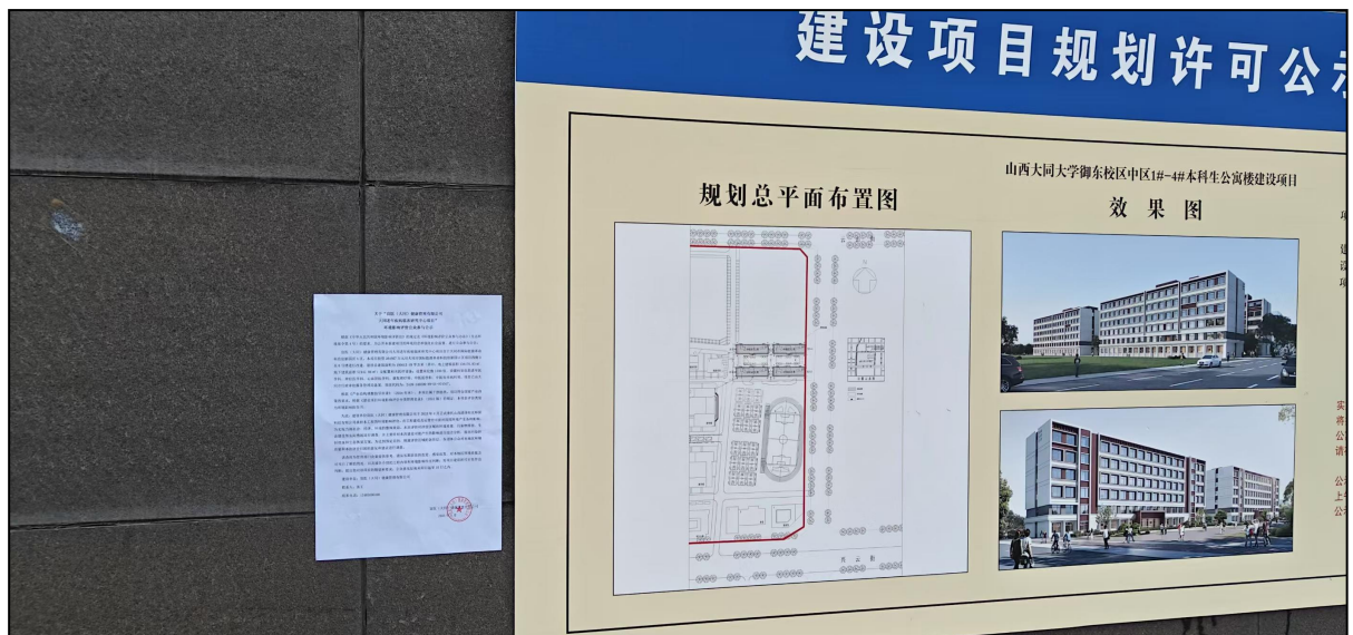
大同大学御东校区