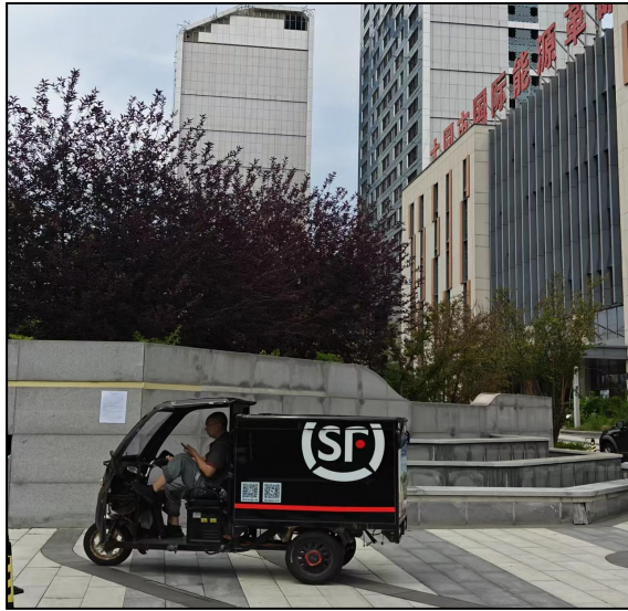
项目区东侧办公楼

我单位对附近可能受影响的居民区进行走访，于 2025 年 6 月 19 日--7 月 3 日在评价范围内的敏感点进行张贴公示。张贴照片如下。