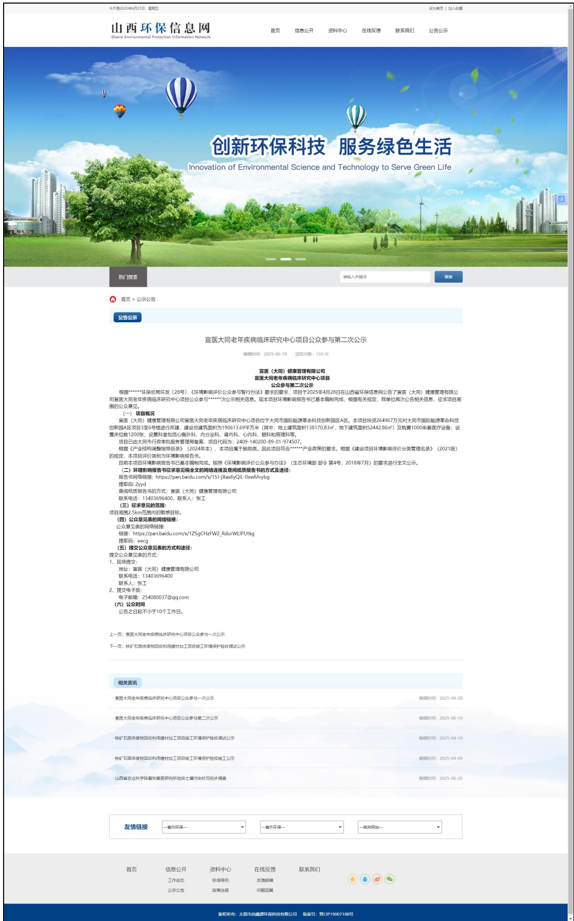
图 2 第二次网络公示