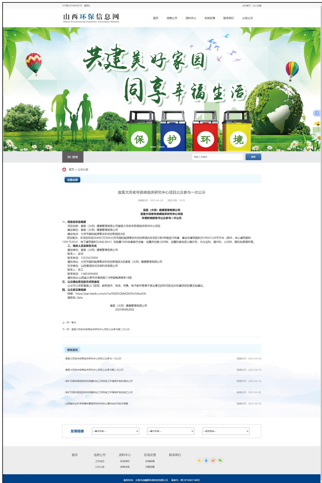
图 1 第一次网络公示