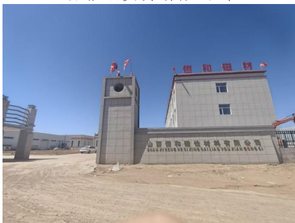
北侧紧邻山西恒和磁材料有限公司