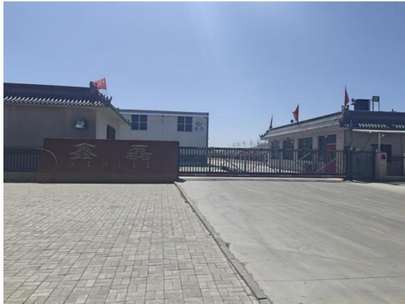
北侧紧邻大同市左云经济开发区鑫磊粮油贸易有限公司