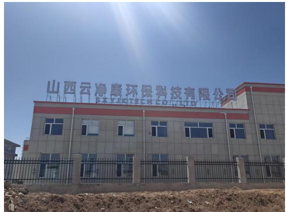
北侧紧邻山西云净康环保科技有限公司