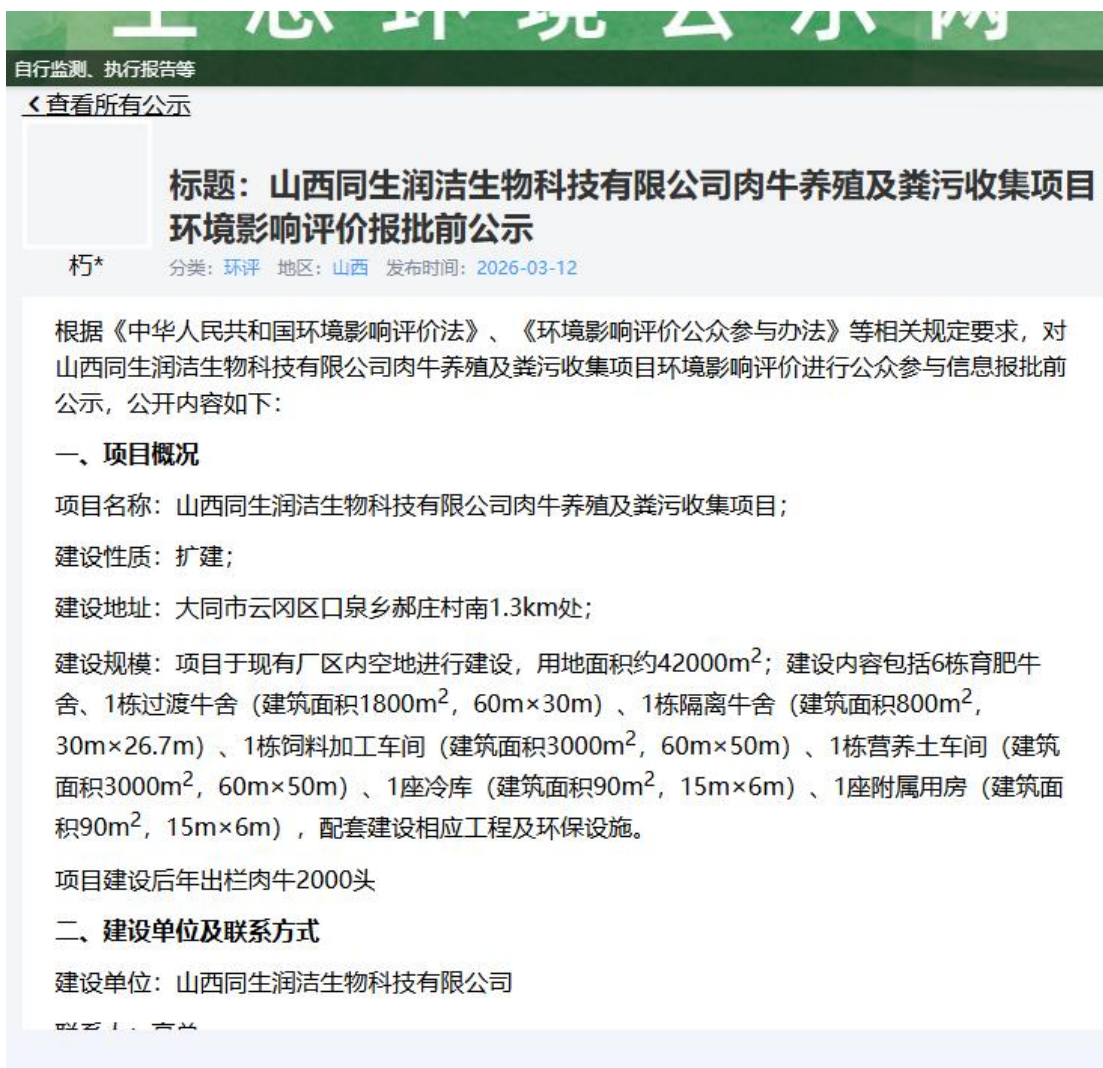
图 1 报批前网站公示截图