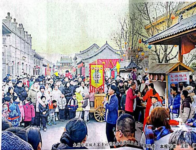
太原古城丰富多彩的民俗活动吸引了众多游客。