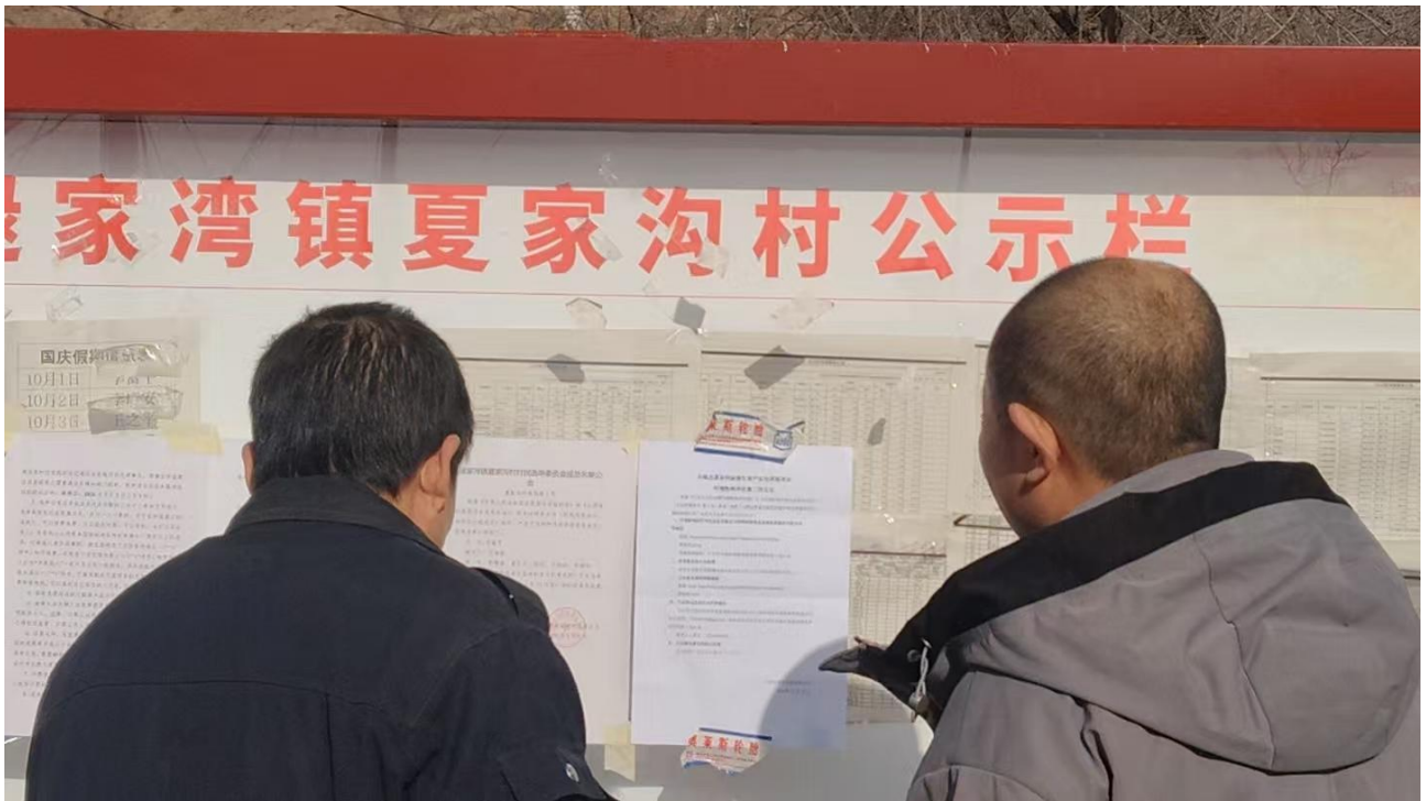
图 5(a) 夏家沟村公告栏公示照片