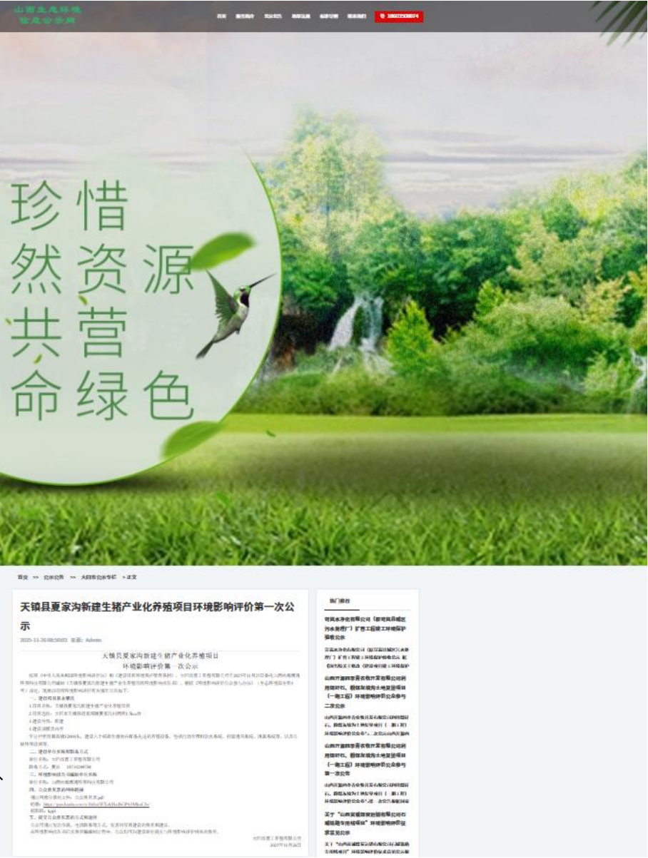
图 1 第一次网络公示