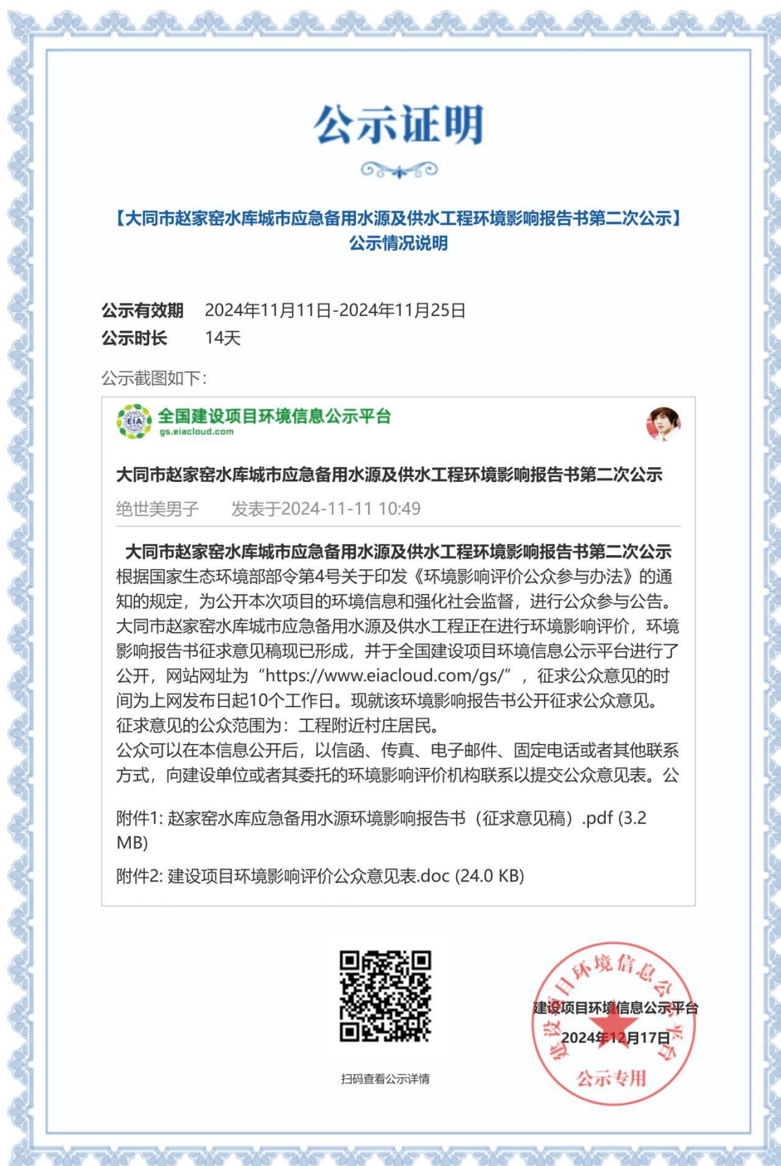
图 3.2-1 网上第二次公示截图