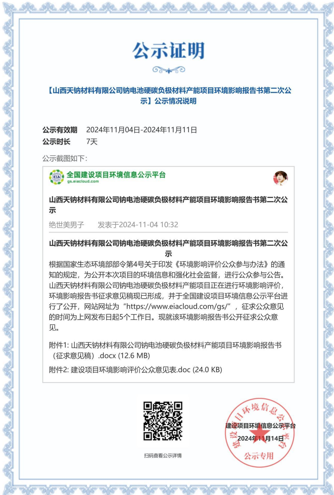
图 3.2-1 网上第二次公示证明