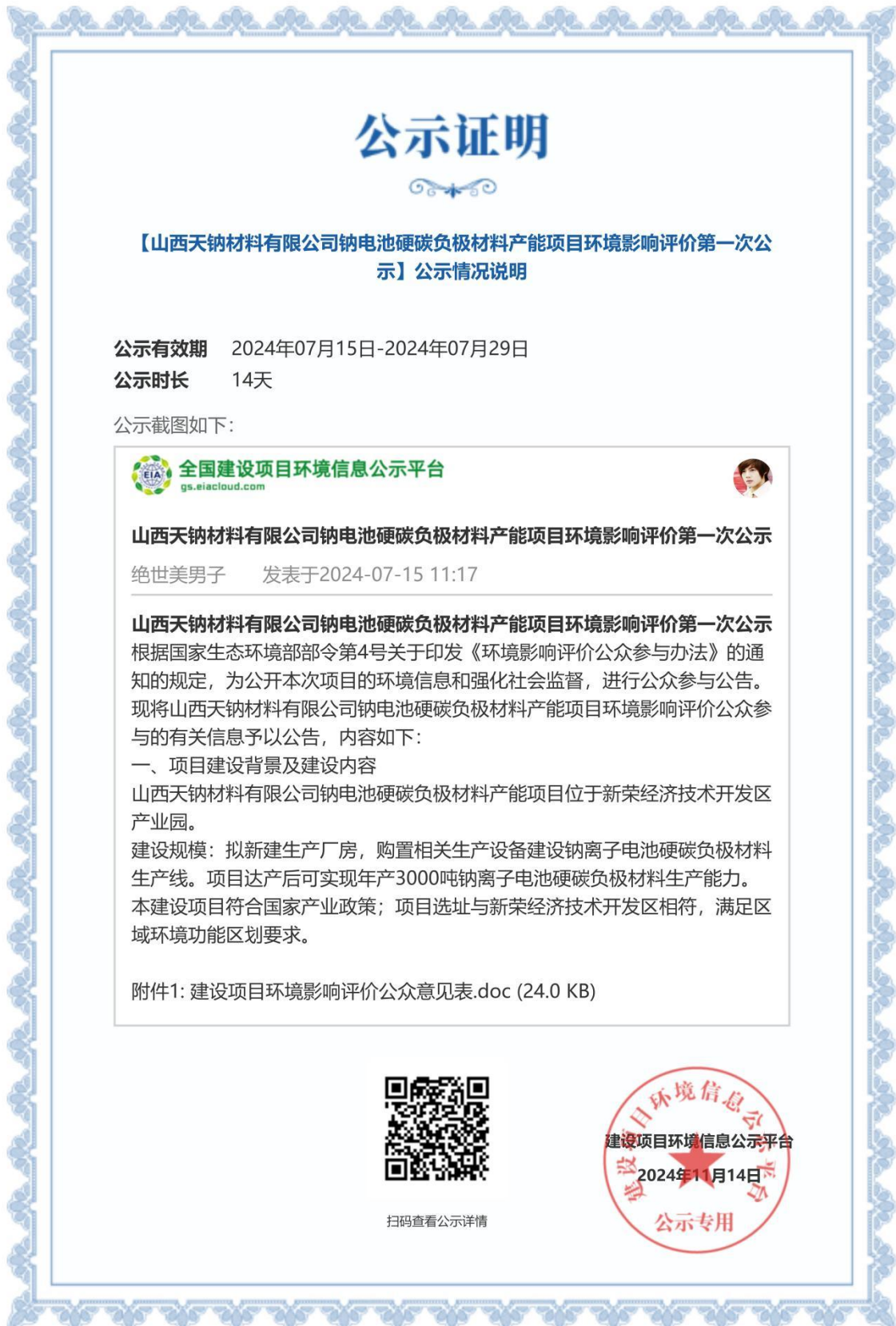
图 2.2-1 网上第一次公示证明