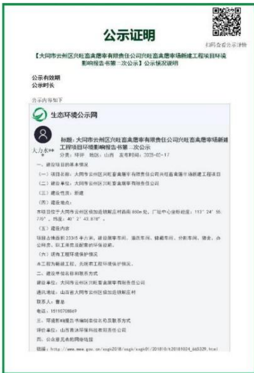
图 2 征求意见稿上网公示截图