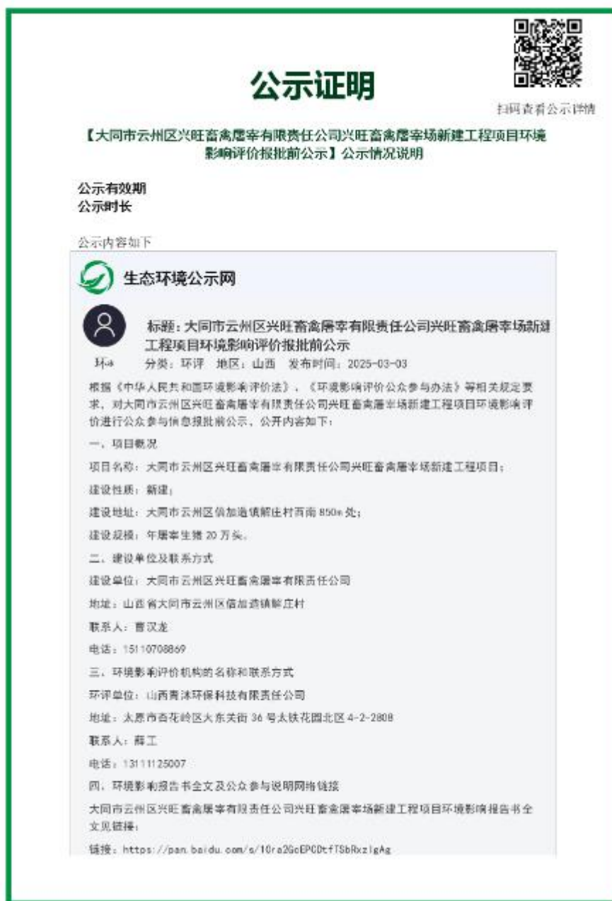
图 3 报批前公示截图